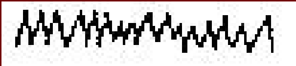
a) pravidelné dýchanie – eupnoe